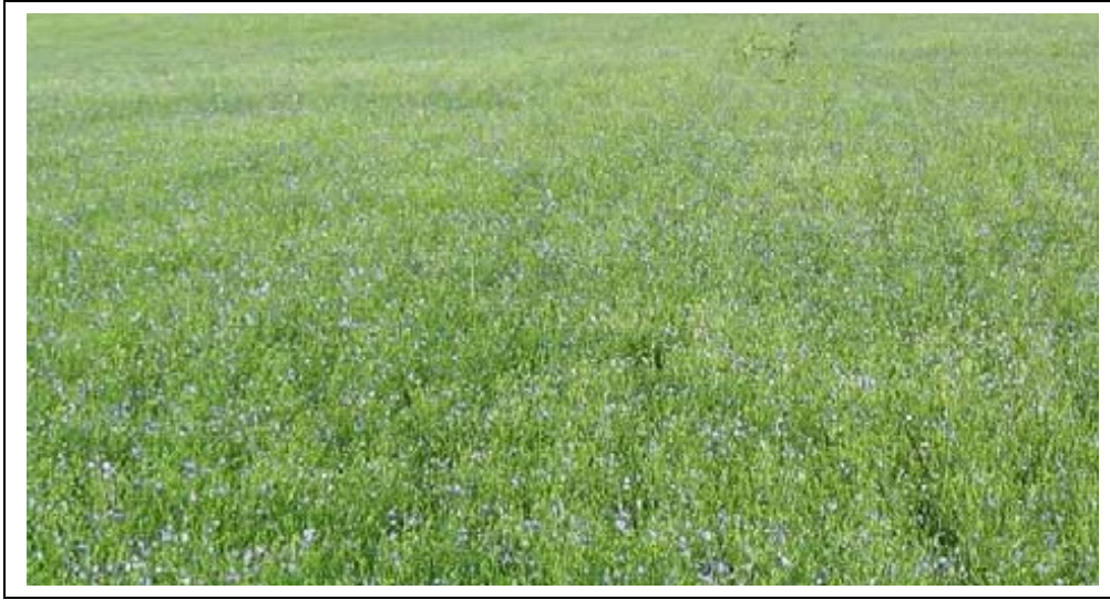
Şekil 1. Keten ekili bir tarla,

FAO daki verilere dayanarak, 2000 yılına ilişkin lif yapımına yönelik dünya keten ekim alanı 491.000 hektardır. Bu alandan yaklaşık 462.000 ton lif elde edilmektedir. Bu üretimin 132.000 tonunu Çin, 32.000 tonunu ise Belarus yapmaktadır. AB orta ve düşük kaliteli lifleri Doğu Avrupa, Mısır ve Çin'den ithal etmektedir. Buna karşı, Avrupa Birliği tüm dünyaya yüksek kaliteli lifler satmaktadır. Bu bağlamda 2000 yılında Avrupa Birliği 103.000 ton lifi başta Çin ve Brezilya olmak üzere tüm dünyaya satmıştır.