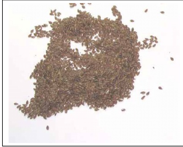
Şekil 2. Keten tohumları,

2001 yılı için Ülkemizde keten ekili alan miktarı 29 ha dır. Ülkemizin keten üretim miktarı 2001, 2002, 2003 ve 2004 yılları için sırasıyla 17 t, 50 t, 55 t ve 55 t dur. Mevcut üretimimiz Kocaeli ve Sinop illeri tarafından gerçekleştirilmiştir (bkz Tablo 1). Keten üretim miktarımızı Avrupa Birliği ülkeleriyle kıyasladığımızda birçok ülkenin oldukça gerisinde kaldığımız görülmektedir. Keten verimi açısından Avrupa Birliği üyesi ülkelerle ülkemizi kıyasladığımızda oldukça düşük bir verime sahip olduğumuz gözlemlenmektedir. 2001 verilerine göre Fransa da verim 100 kg/ha cinsinden 41.945 iken ülkemizde bu değer 0.586 dır. Avrupa Birliği üyesi ve aday ülkelerin keten verimlerine ilişkin veriler Ek 3 de gösterilmiştir.