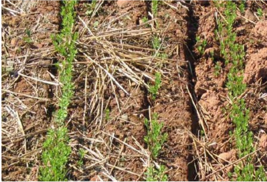
Şekil 3. Keten ekili bir tarla,

Macaristan 1 958t, Polonya 31 t ve Lüksemburg da 8 tonluk bir üretim söz konusudur. Avrupa Birliği üyesi ve aday ülkelerin kenevir üretimlerine ilişkin veriler Ek 5 de verilmiştir.