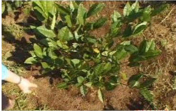
Resim 2.2: Kimyasal gübrenin doğru verilışı