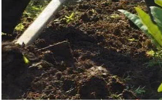
Resim 2.1: Ahır gübresi verilmesi