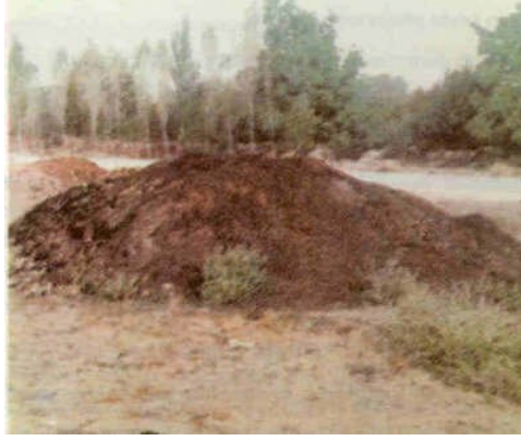
Resim 1.1: Ahır gübresinin bahçede depolanması