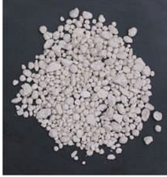
Resim 1.6: Potasyumlu gübre