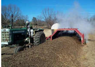
Resim 1.3: Yeşil gübre bitkileri

Yeşil gübrelemede, daha ziyade fiğ, bakla, soya fasulyesi, taş yoncası gibi havanın azotundan istifade ederek köklerinde azot biriktiren ve bu sebeple toprağı azotça zenginleştiren bitkinin seçilmesi en uygundur. Yapılan birçok denemeler neticesinde, bunların kendilerinden sonra gelen mahsulün verimini % 20–100 arasında artırdığı görülmüştür.