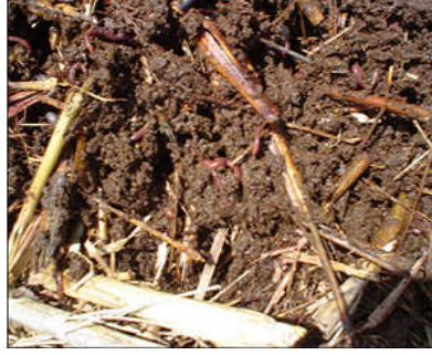
Resim 1.2: Çiftlikte meydana gelen bitki ve hayvani menşeli artıklar

Sanayi şeklinde kompostlama da mümkündür ve farklı çeşitleri vardır. Kompostlama aslen bir fermentasyon biçimidir. Aerobik ve anaerobik olarak ikiye ayrılmaktadır.