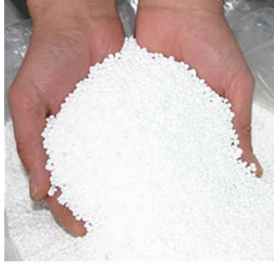
Resim 1.5: Azotlu gübre

Azotlu gübrelerin çeşitli tipleri vardır. En çok amonyum ve nitrat tuzları hâlinde kullanılır. Bunlar arasında en önemlileri, sırasıyla amonyak ve amonyum hidroksit, amonyum nitrat, amonyum sülfat, amonyum fosfat, sodyum nitrat, kalsiyum nitrat, potasyum nitratdır. Bunlardan amonyak sıvı, diğerleri ise katı olup amonyaktan elde edilirler. Kalsiyum nitrat ve potasyum nitratın dışındaki bütün azotlu gübreler toprağı asidik yaparlar. Fakat bu asitlik uygun kireçleme ile kolaylıkla düzeltiler. Siyanamid, üre ve üre-form adı verilen üre-formaldehid bileşiğı de azot gübresi olarak kullanılmaktadır. Ayrıca bu sayılan bileşiklerin değışik oranlardaki karışımları ayrı patentler altında piyasaya sunulmaktadır.